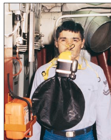
Ecco un'immagine dell'RDE Ocenco M-20.2 indossato e pronto all'uso.

Il compatto RDE Ocenco M-20.2 può essere portato agganciato alla cintura in tutti gli spazi ristretti.